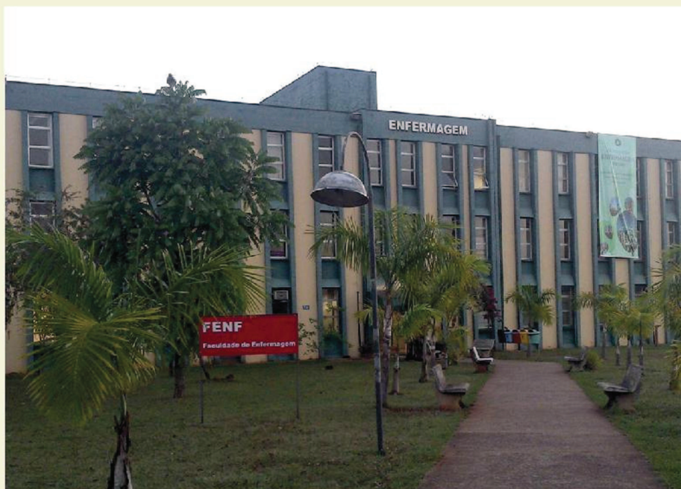
FACULDADE DE ENFERMAGEM